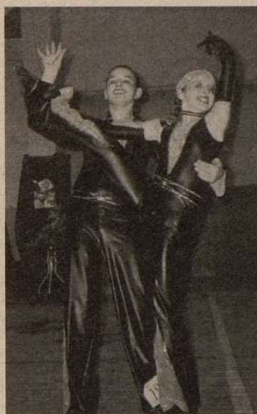
кой культуры им. Лесгафта.

Занятия проводят опытные педагоги, мастера спорта и тренеры высшей категории, выпускники государственной академии физичес-