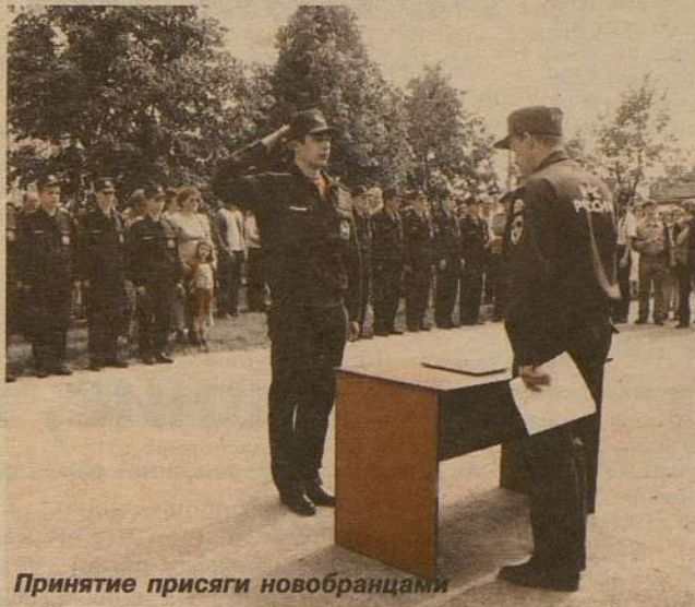
Принятие присяги новобранцами