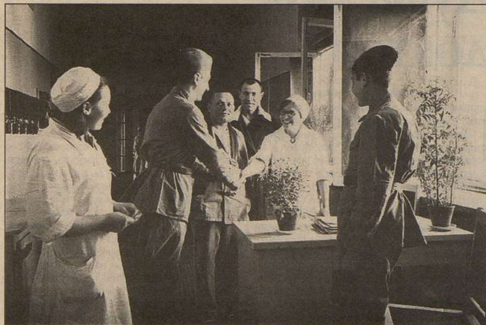
Выздоровевшие раненые бойцы прощаются с врачами. 26 октября 1942 года

Организм человека вынослив, и даже очень, но не беспредельно. От резких перепадов дневных и ночных температур иногда хватало воспаления легких или тепловой удар. Но никого не миновала коварная и страшная болезнь – амебная (еще называют ее «пустынная») ди-