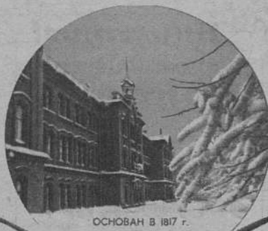
ОСНОВАН В 1817 Г.