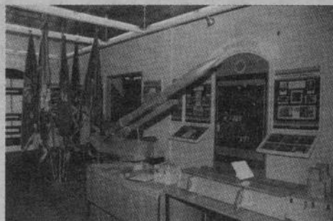
Общий вид первого зала музея. В центре – модель пусковой установки зенитного ракетного комплекса С-75.

Неоспорима ведущая роль Петербурга в создании российского флота и превращении России в великую морскую державу. Новая столица, основанная на берегу Балтийского моря, укрепила и расширила политические, экономические и культурные связи со странами Западной Европы и Америки.