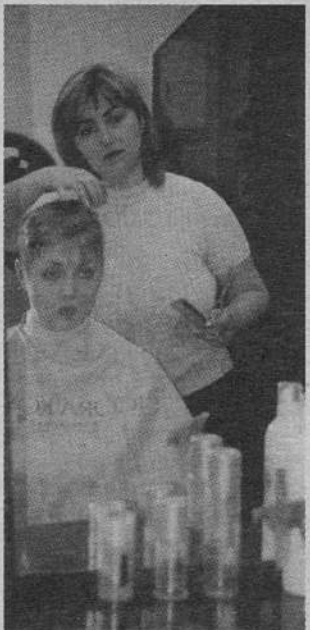
Люди района. Тел.: 107-90-23.