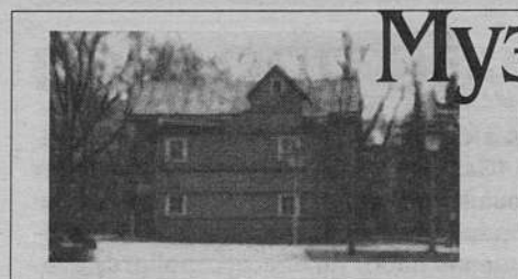
(Начало в № 10)

Наш район единственный в городе расположен на обоих берегах Невы, где с незапамятных времен жили финно-угорские племена: ижора, корелы, воды. С VIII века свободные земли начали мирно заселять славяне, пришедшие с юга. В IX веке эти земли вошли в состав древнерусского государства, а в XII - стали частью новгородских владений. Река Нева была частью богатых торговых путей, ведущих из Балтийского моря в Черное и Каспийское, поэтому за эти приневские земли шла ожесточенная борьба с соседями: немцами и шведами. Ижорская земля прикрывала Русь от врагов. Большая красочная карта «Борьба за невиские земли», находящаяся в экспозиции музея, поможет ярче представить эту борьбу. Мы видим, где располагались крепости, построенные новгородцами для защиты от врагов.