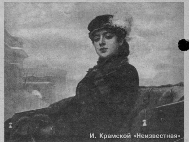
И. Крамской «Неизвестная»