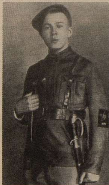
1920 год. Аркадий Гайдар – командир роты в 16 лет.

Сюжет рассказа – не вымысел. Поводом для него послужили информации о спасении судна, опубликованные областной газетой в ноябре 1929 года, и архивные документы: командировочное удостоверение Гайдара, текст радиogramмы в редакцию, написанный им на тетрадном листе латинскими буквами. Правда удивляло, почему Аркадий Петрович, побывав в этой командировке, ограничился всего лишь короткими телеграфными сообщениями. Вряд ли опытный журналист, каким к тому времени уже был Гайдар, став участником такого неординарного события на море, не воспользовался бы возможностью написать об этом более обстоятельно. Добраться до истины мне удалось с помощью следопытов из архангельс-