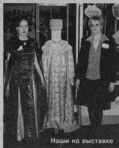
Наши на выставке

«игры», так как меньшая их часть голосует «ногами», срывая кворум. Хотя долго это продолжаться не будет - даже не разделившись на комиссии и не выбрав заместителей председателя ЗАКСа, работать можно и нужно (принимать депутатские запросы, рассматривать подготовленные ранее проекты, знакомить с процедурами и регламентом впервые избранных депутатов...). Причем срыв заседаний и задержка с формированием комиссий не добавит авторитета ни законодательной, ни исполнительной ветвям власти (мы видим по телевидению, сколько внимания уделяет губернатор, казалось бы, внутриЗАКСовским проблемам). Ведь горожанам нужны не политические преграды, а конкретные дела «единой и неделимой» власти. Жизнь города не может останавливаться из-за личных амбиций некоторых депутатов и чиновников. Тем более когда нужно решать проблемы жителей, корректировать бюджет, выполнять обещанное на выборах, короче - любить «искусство в себе», а не «себя в искусстве».