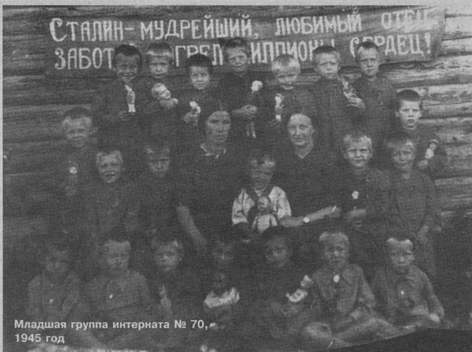
Младшая группа интерната № 70, 1945 год