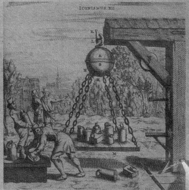
Измерение силы разрежения воздуха Иллюстрация из книги «Новые эксперименты с вакуумом»