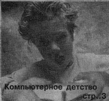
Компьютерное детство стр. 3