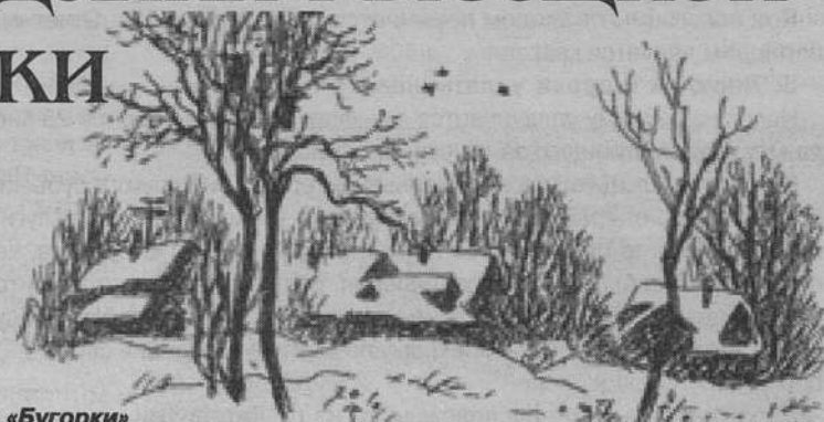
«Бугорки» Рис. Т.В. Соловьевой-Домашенко

Историко-краеведческий раздел открывается статьей А.Векслера «Невскому району - 85 лет», в которой автор прослеживает историю района, впервые используя большой материал, выявленный им в городских архивохранилищах и Российской национальной библиотеке. Статья иллюстрируется фотографиями зда-