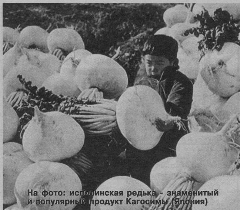
На фото: исполинская редька – знаменитый и популярный продукт Кагосимы (Япония)

Ученые утверждают: чтобы психические и умственные нагрузки не стали роковыми для человека, ему нужна перемена обстановки, отключение от обычных ритмов. Хороший отдых должен быть контрастным, непохожим на повседневный быт. Еще великий И.П. Павлов писал: «Мне стало понятным, почему... столовая должна быть особой, чтобы она ничем не напоминала о работе, чтобы на пороге ее оставались все заботы дня». Отсюда и тяга людей к природе, ко всему необычному, непримелькавшемуся. Жители большого города хочется деревенской тишины, единения с природой. Многие значат обстановка, атмосфера, настроение. В последние пару десятилетий появились всевозможные оазисы гостеприимства, интерьеры которых поражают воображение путников, гостей ресторанов. Это замки и трактиры, корчмы и таверны, погребки, постоялые дворы и терема. Записанные на магнитофонную пленку заливы голоса петухов являются зазывными ресторана «Золотой петушок». При входе на срезе большого пня выжжены названия блюд – сегодняшнее меню. Полы, лавки и столы из толстых досок. В Суздале под ресторан «Суздаль» переоборудованы старые купеческие лабазы. Интерьеры стилизованы под