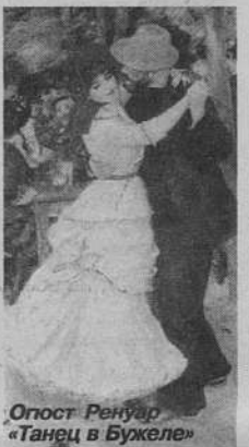
Огюст Ренуар «Танец в Бурже»

С 3 июля по 16 сентября в зале Государственного Эрмитажа проходит выставка «Шедевры музеев мира», где впервые в нашем городе представлено полотно Огюста Ренуара «Сестры (На террасе)».