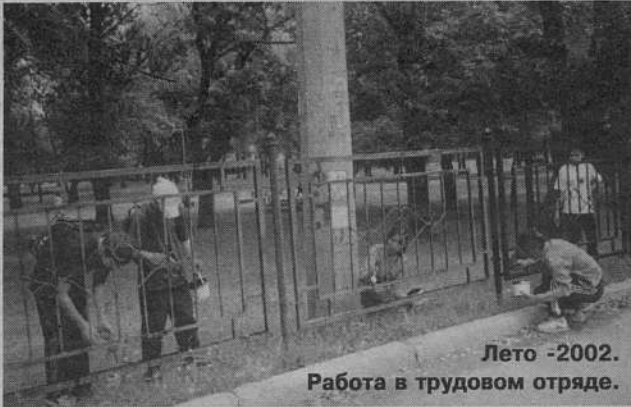
Лето -2002. Работа в трудовом отряде.

Активно работал Муниципальный совет и в социальном секторе: кроме уроков военно-патриотического воспитания, проводились