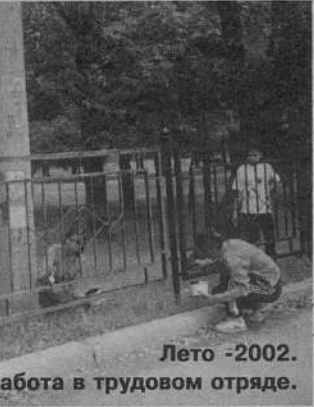
Лето -2002. Работа в трудовом отряде.

Но самым главным вопросом было и остается финансирование. Многие просят муниципалов о финансовой поддержке, но, к сожалению, помочь они могут не всем, поэтому составление бюджета на 2003 год ведётся с