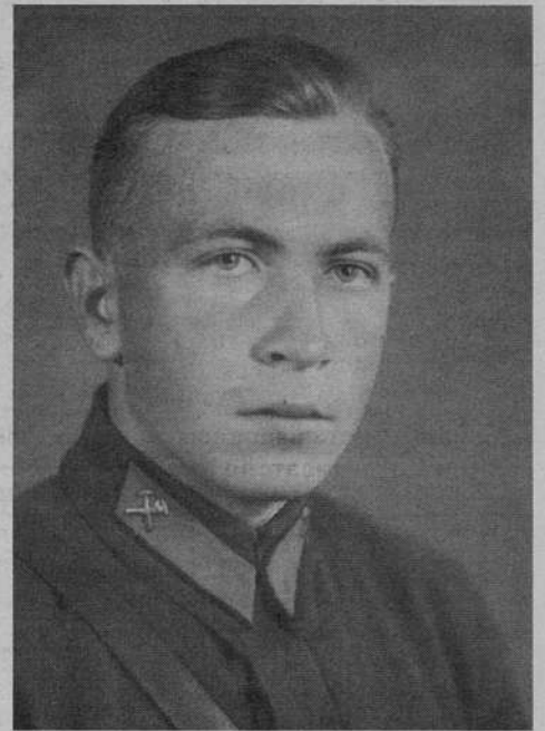
Иногда вижу себя во сне таким. «... такой, как на карточке старой Без шрамов военной поры. Еще не выдавший пожаров, Еще не ходивший в прорыв!»