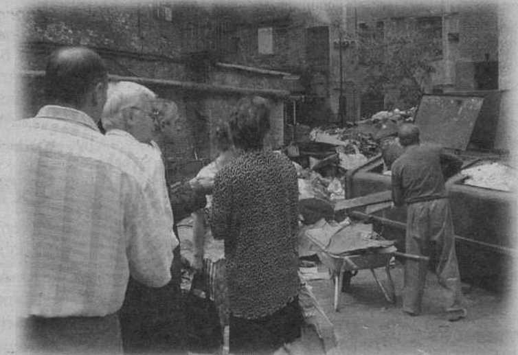
Рейд постоянной комиссии по экологии МО № 49

Такая ситуация не может не волновать местные органы самоуправления. В муниципалитетах создаются постоянные комиссии. Тщательно анализируется законодательная база, определены схемы взаимодействия и сроки выполнения работ. В настоящее время специалистами Центра обследованы наиболее значимые по влиянию на экологию предприя-