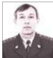
ТИТОВ Игорь Вячеславович