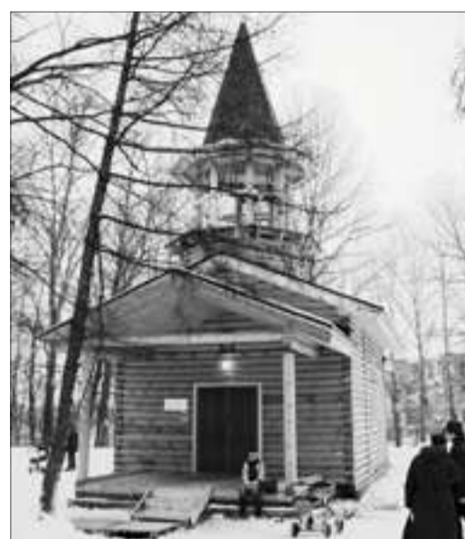
Храм-часовня Покрова Пресвятой Богородицы в Рыбацком