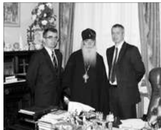
На приеме у митрополита Санкт-Петербургского и Ладужского Владимира