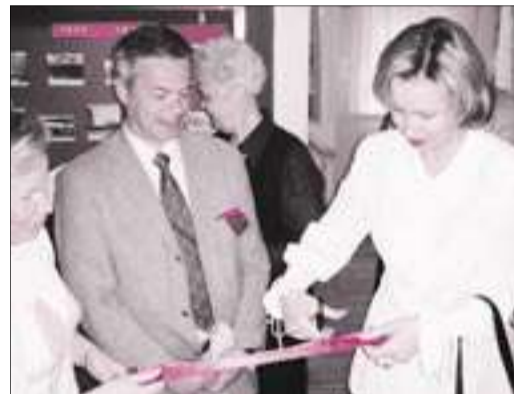
На открытии выставки «Невский район в годы Великой Отечественной войны» в музее «Невская застава»