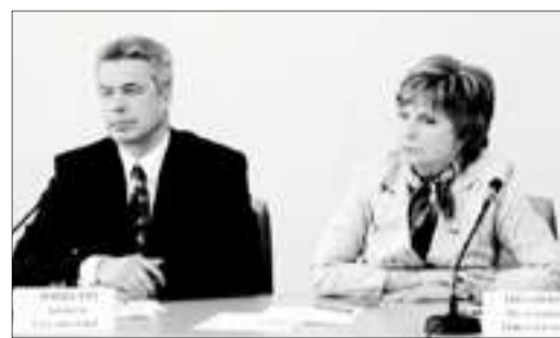
Депутатские слушания в Маринском дворце 25 апреля 2005 года