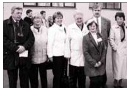
Традиционный праздник – день рождения Рыбацкого