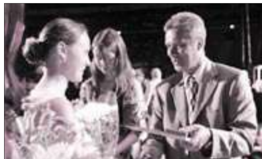
Бал выпускников в Ледовом дворце