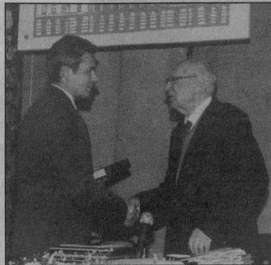
На юбилей кавалера ордена св. Андрея Первозванного, академика Д.Лихачева.

1 июля 1998 года Президент Российской Федерации подписал Указ "О восстановлении ордена Святого апостола Андрея Первозванного".