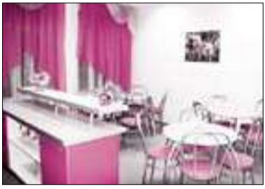
(Начало на стр. 1)

Наличие такого центра в районе очень важно, здесь есть все для детей: тренажерный зал, компьютеры, музыкальные занятия, мультики, молодые педагоги, психологи. Сюда можно прийти после занятий в школе.