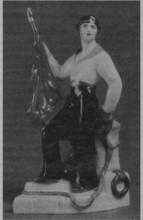
Хочется пожелать замечательным труженикам завода с честью выдержать испытания и продолжать радовать всех своим чудесным фарфором.

В 1980 году завод был удостоен международной премии "Золотой Меркурий" "... в знак особого признания его вклада в развитие производства и международное сотрудничество". Сейчас у завода наступили трудные времена.