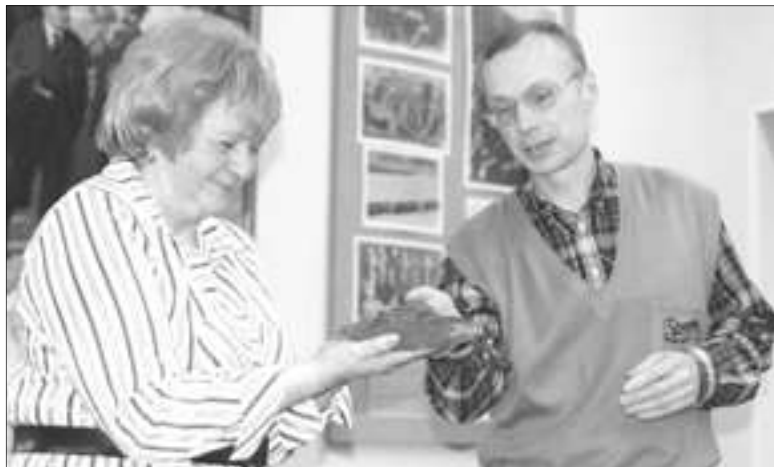
От сотрудников Эрмитажа музей получил в дар деталь крепежа, изготовленную на Александровском заводе для Зимнего дворца

Именно сейчас предприятиям важно сохранить свою историю и создать условия для полноценного функционирования музеев, если они уже имеются. Руководство ОАО «Пролетарский завод» во все времена поддерживало свой музей. Приступив к работе в 1968 году, музей истории Пролетарского завода не закрывался практически ни на один день. Он работал даже в кризисные периоды, когда музеи многих про-