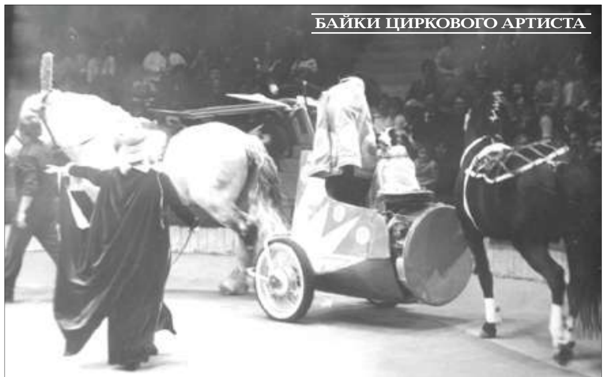
БАЙКИ ЦИРКОВОГО АРТИСТА

Ждем вас: КЦ «Троицкий», II этаж, кл. № 209, понедельник с 16.00 до 18.00, пятница с 16.45 до 18.00.