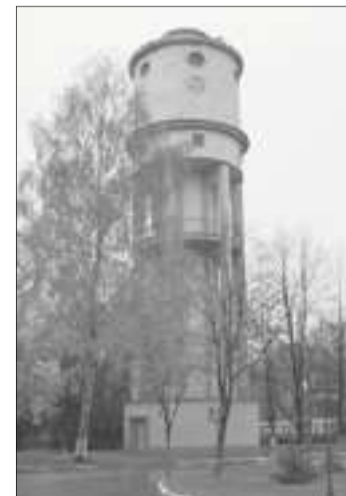
У завода есть своя «пизанская» башня. Из-за ошибки в проекте она наклонена в правую сторону. Построенная в 1932 году водонапорная башня ни дня не использовалась по назначению. Во время войны она была наблюдательным пунктом войск местной противовоздушной обороны. Сегодня это высотная доминанта завода.