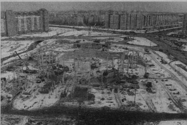
Март 1999 года