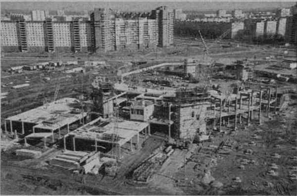
Апрель 1999 года