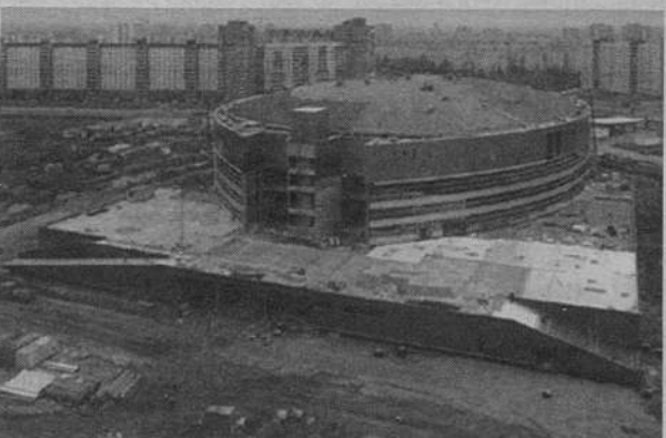
Октябрь 1999 года