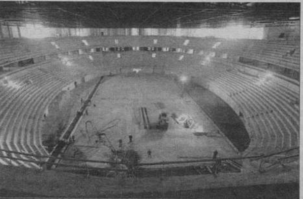
Ноябрь 1999 года

Первый матч на кубок Дворца спорта по уличному хоккею среди школ Невского района прошел в дни школьных каникул на арене строящегося комплекса.