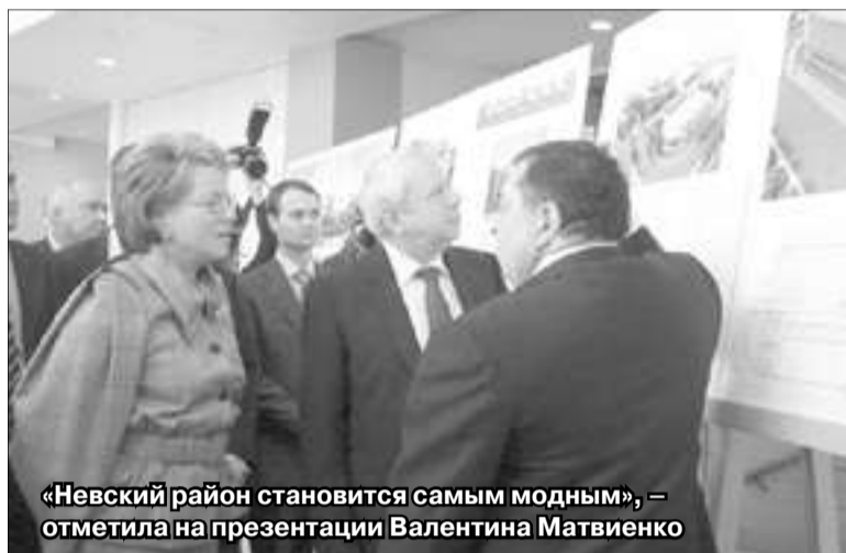
«Невский район становится самым модным», — отметила на презентации Валентина Матвиенко

5 сентября состоялась торжественная церемония посвящения в студенты и презентация реконструированного учебного корпуса Санкт-Петербургского государственного университета телекоммуникаций им. проф. М. А. Бонч-Бруевича.