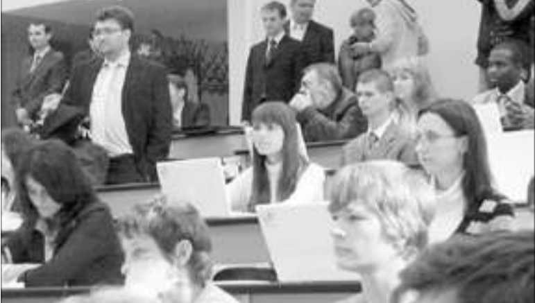
Трансляция материала на большой экран в лекционной аудитории дублируется на персональный компьютер студента

Ректор университета Александр Гоголь отметил, что в планах дальнейшей реконструкции второй корпус, спортцентр, библиотека и технопарк – «целый квартал высоких технологий». Также он обратился к губернатору города с торжественной петицией о переименовании станции метро «Улица Дыбенко» в станцию «Технопарк».