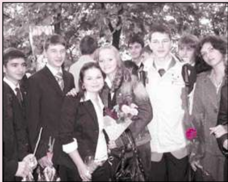
Выпускники юбилейного 2009 года