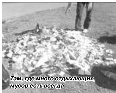
Там, где много отдыхающих, мусор есть всегда

парке у Невы, где он часто отдыхает и бегает: «Парк у реки – это большое место. Именно сюда приезжают многочисленные отдыхающие и, к сожалению, как правило, думающие только о собственном комфорте. Появились единомышленники, благо современные социальные сети позволяют заявить о себе».