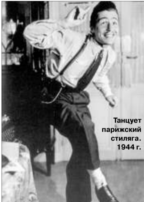
Танцует парижский стилига. 1944 г.

В первые годы существования данного феномена облик советского стилига был, скорее, карикатурен: яркие брюки клеш, мешковатый пиджак, шляпа с широкими