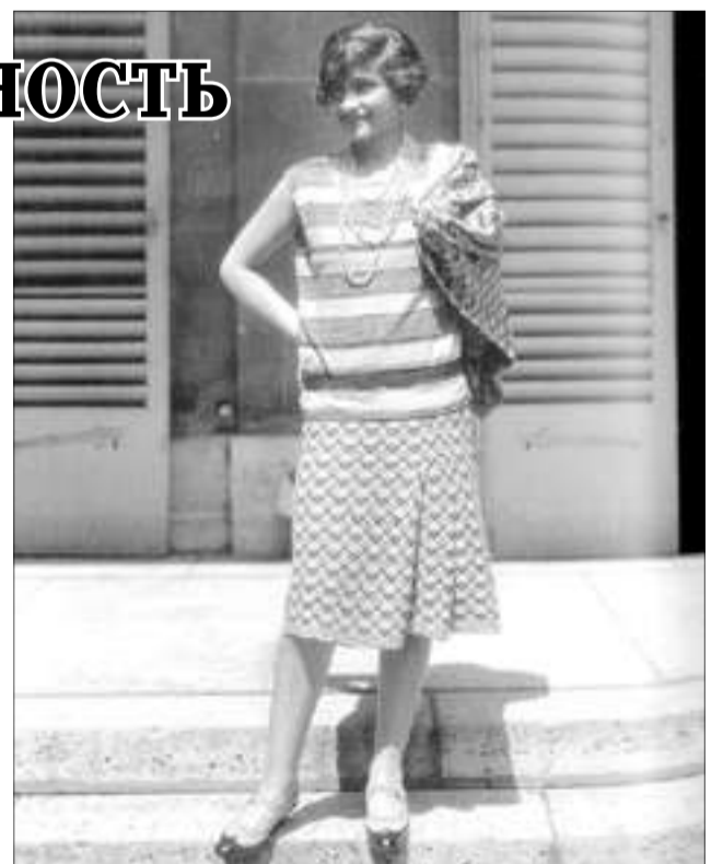
Габриэль Шанель (1883-1971) – первый модельер, которому удалось занять столь высокое положение в обществе. Ее клиенток привлекал не только неподражаемый стиль Великой Мадемуазель, но и сама личность Коко, ее гипнотическая привлекательность.

По материалам книги «Шик&Шарм», lchnosti.net