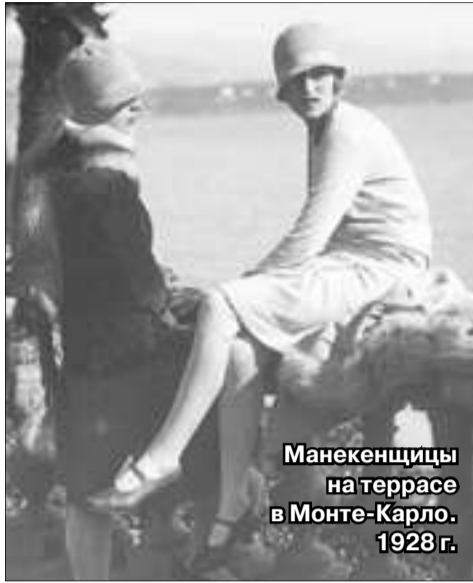
Манекенщицы на террасе в Монте-Карло. 1928 г.

Мода – это своеобразная форма самовыражения человека. Мода является языком признаков, символов, которые без слов характеризуют человека и указывают на его принадлежность к определенному социальному слою. Благодаря одежде и аксессуарам мы создаем свой образ, который в свою очередь формирует впечатление о нас. Мода меняется каждый сезон, но тенденции повторяются, поскольку ее развитие идет по спирали. Итак, что же носили наши предки?