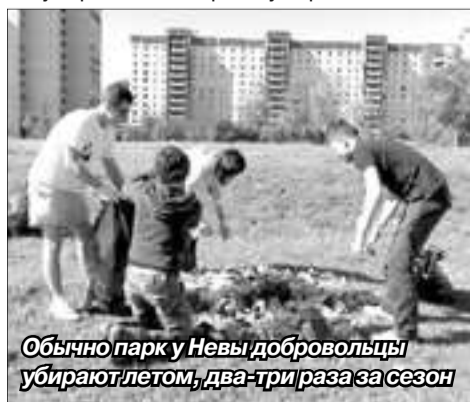
Обычно парк у Невы добровольцы убирают летом, два-три раза за сезон