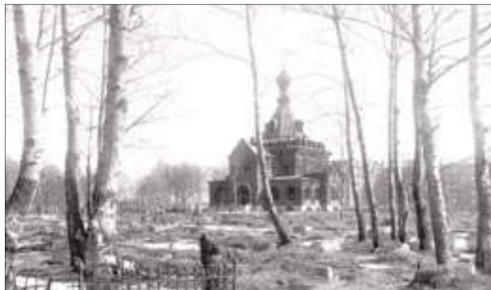
Церковь Сошествия Святого Духа. Ивановская, 9. 1940 год.

Ни одного документального подтверждения о захоронениях во время Великой Отечественной войны не существует.