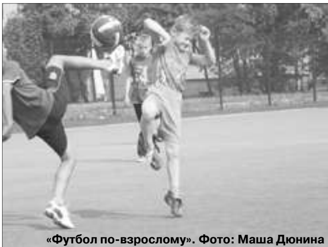
«Футбол по-взрослому».