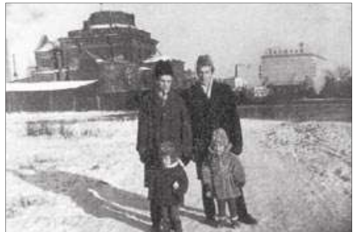
Церковь Сошествия Святого Духа. 1960-е гг.