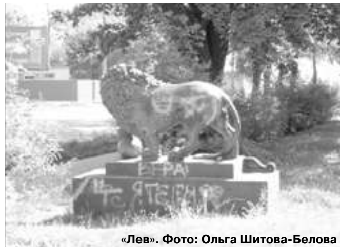
«Лев». Фото: Ольга Шитова-Белова