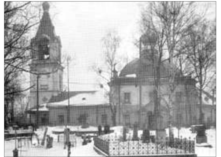
Церковь Спаса Преображения Господня при Фарфоровом заводе – первый храм Невской заставы