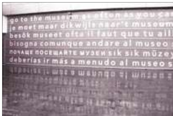
Оригинальное напутствие посетителям Музея Ван Гога в Амстердаме