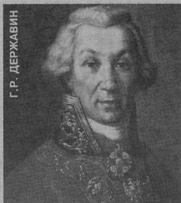
Г. Р. ДЕРЖАВИН