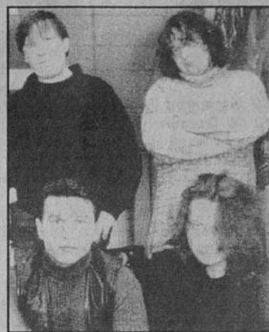
«СЛАВЯНКА» — ЛУЧШАЯ ЖЕНЩИНА В МИРЕ!!!