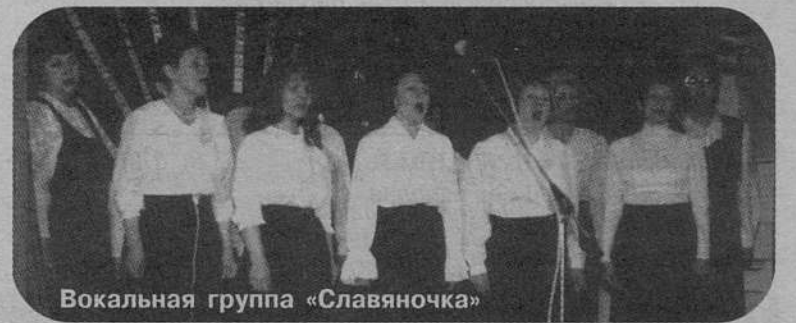
Вокальная группа «Славяночка»