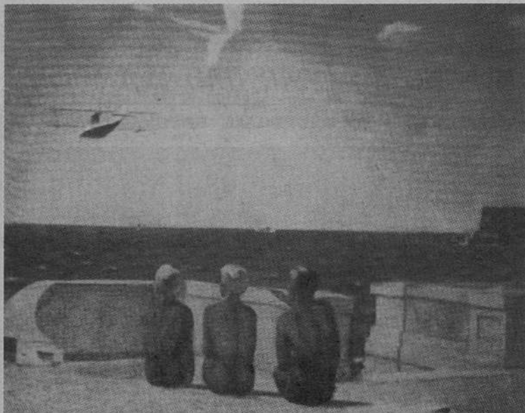
Александр Дейнека «Будущие летчики»