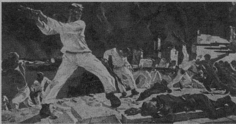
Александр Дейнека «Оборона Севастополя»