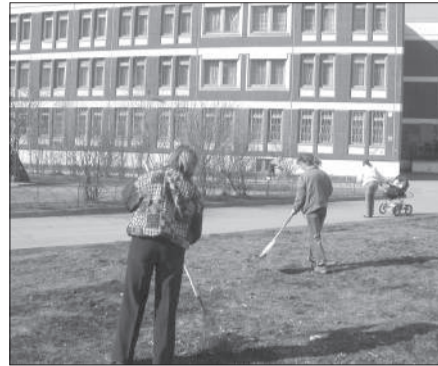
Масштабные работы по уборке района после зимы начались 31 марта

21 марта районный штаб благоустройства Невского района принял постановление «О весеннем месячнике по благоустройству, озеленению и уборке территорий Невского района после зимнего периода в ознаменование празднования 90-летия Невского района Санкт-Петербурга и подготовке к празднованию Дня Победы в Великой Отечественной войне и Дня города».