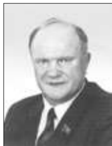
ЗЮГАНОВ ГЕННАДИЙ АНДРЕЕВИЧ

Родился 26 июня 1944 года в деревне Мырдино Хотынецкого района Орловской области. Место жительства - Москва.