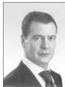
МЕДВЕДЕВ ДМИТРИЙ АНАТОЛЬЕВИЧ

Женат, имеет сына и дочь, семь внуков и внучку.