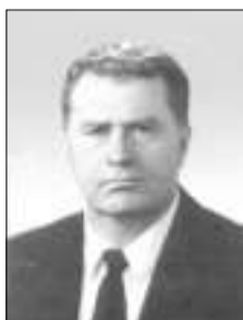
ЖИРИНОВСКИЙ ВЛАДИМИР ВОЛЬФОВИЧ

Родился 25 апреля 1946 года в городе Алма-Ате. Место жительства - Москва.