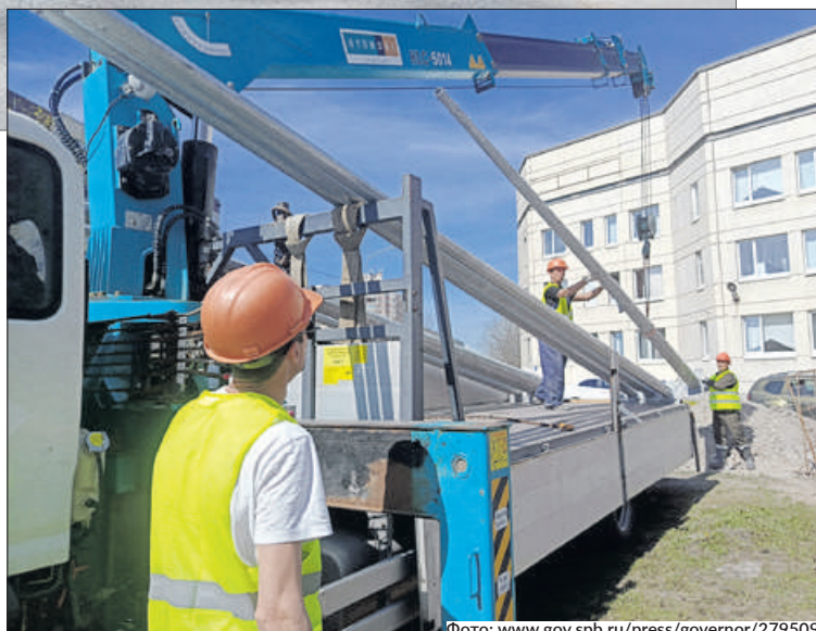
Новое световое оборудование будет установлено в квартале, в границах которого проживают около 10 тысяч жителей Невского района, размещены социальные объекты.

На рабочем совещании губернатора Александра Беглова с членами городского правительства утверждён проект планировки с проектом межевания территории в Невском районе между Дальневосточным проспектом, Октябрьской набережной и двумя проектируемыми улицами. Инвестор планирует построить там жилые дома, а также два детских сада на 190 и 250 мест, школу на 1125 мест, физкультурно-оздоровительный комплекс, диагностический центр, объекты бытовых услуг и культуры, инженерные и другие