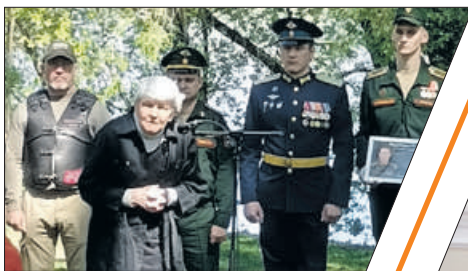
АЛЛЕЯ В ЧЕСТЬ ГЕРОЕВ СВО