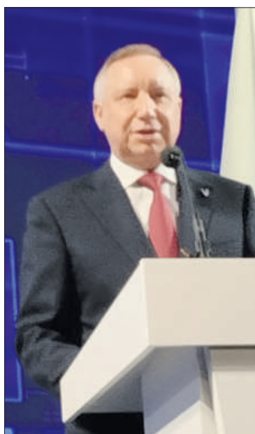
Фото: Сергей Иванов.