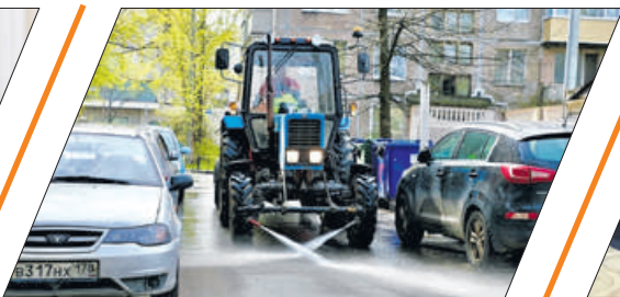
КАК РАЙОН ПОДГОТОВИЛСЯ К ЛЕТУ?