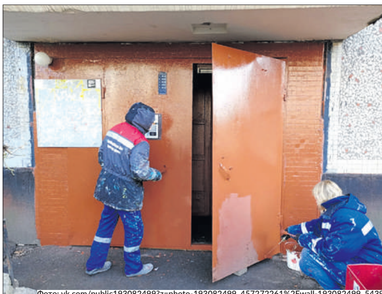
Помыто и отремонтировано более 18 800 окон на лестничных клетках домов города, более 25 000 входных дверей в парадные.