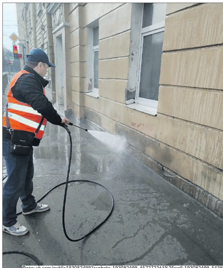
Несмотря на казусы погоды, в апреле в Петербурге помыто более 5100 фасадов. Данный вид работ будет продолжен.

! В настоящее время в квартале идут строительные работы: установка опор наружного освещения, прокладка кабельной линии, подготовка светильников к монтажу. Всего будут установлены 117 опор и 167 светодиодных светильников. Завершить строительство планируется осенью 2024 года.