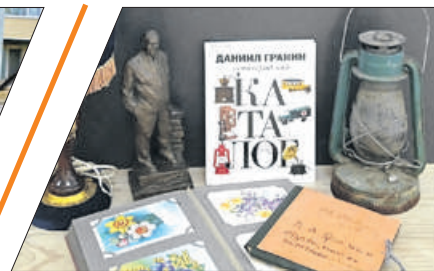
РАССКАЖИ О СЕМЕЙНОЙ РЕЛИКВИИ