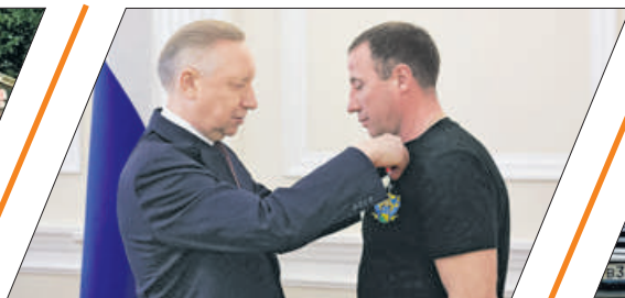
ДОБЛЕСТЬ И ОТВАГА ЖИТЕЛЯ РАЙОНА