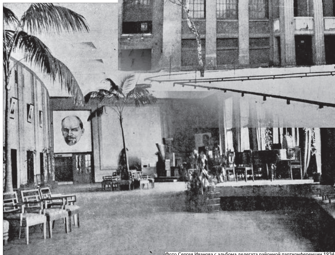
Фойе Володарского дома культуры, 1934 г.

В 1943 г. в Володарском доме культуры работали три кружка: хореографический, драматический и сольного пения. В них занимались 60 человек. Участники кружков давали концерты на сцене ДК, на предприятиях, в госпиталях, воинских частях, на кораблях. Были поставлены спектакли «Русские люди», «Земля подтверждает», «Парень из нашего города», «Женидьба Белугина», «Анна Каренина»; оперы: «Евгений Онегин», «Пиковая дама», «Травиата»; балеты «Ко-