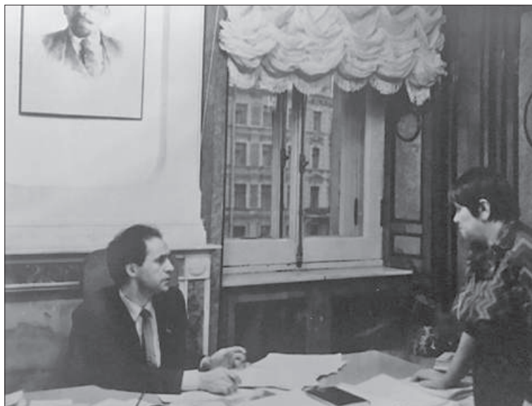
В 1990 году, когда коллектив избрал меня руководителем дворца, я стал первым выбранным директором.

Работа во дворце не была для меня работой в привычном смысле этого слова: я не различал где дворец, а где дом.