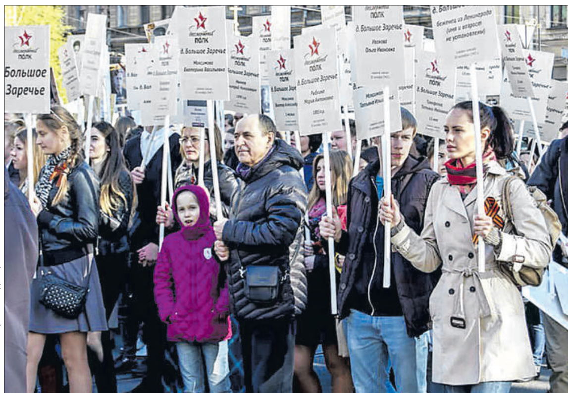
Я не поддерживаю разговоры о том, что сейчас молодёжь интересуется только деньгами. Это не правда.