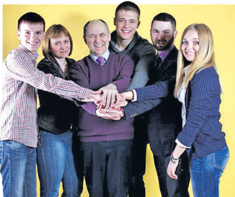
Мы часто произносим фразу – дети творцы XXI века, но ведь «творцов» ещё надлежит сотворить.

Был у нас опытный участок в Орловском переулке, рядом со Смольным. Замечательные наши грядки, уходящие в землю теплицы, сырые домики без