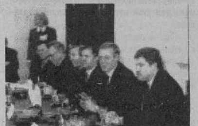
Идет пресс-конференция, посвященная 5 годовщине со Дня образования РАО ВСМ

— В тех условиях, в которые было поставлено РАО, его деятельность достаточно эффективна. Решен целый ряд задач, на которые изысканы деньги за счет текущей деятельности общества. Вот это главное обоснование его эффективности.