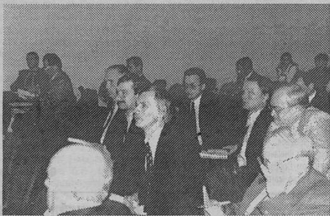
Совместный день депутата города и области.