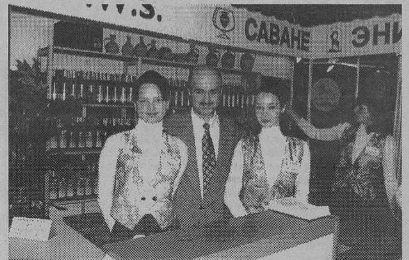
Лучшие вина Грузии представляет "Nature Art"

С 22 по 26 октября в выставочном комплексе Ленэкспо на Васильевском острове проходит третья международная специализированная выставка продукции виноделия и ликеро-водочных изделий "Осенняя ярмарка вин – 98"