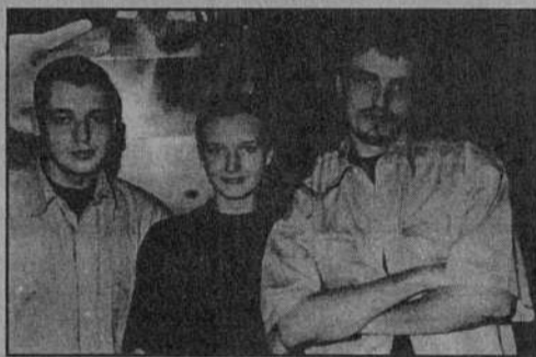
На фото: "Руки вверх" в клубе «MAD WAVE».

Этим летом детский голосок, лепетавший "я хороший мальчик" и "ля-ля-ля-ля", доносясь из каждого ларька и автомобиля, неизменно вызывал улыбку и у молодежи, и у ворчливых старушек. Ну, а дискотеки и сегодня редко обходятся без "Студента" тех же "Рук вверх".