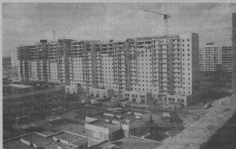
Строительство нового дома в Рыбацком

Вопрос: Скажите, может быть, у Вас было бы меньше хлопот, если бы прошел обычный панельный вариант.