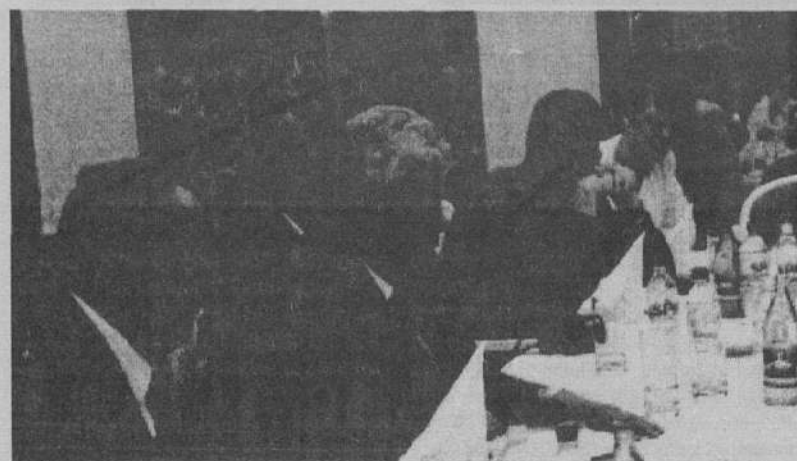
Президент республики Саха Михаил Николаев

предложения в план работы на новый год. План включает в себя самые различные мероприятия по всем отраслям районного хозяйства, например, подготовка служб к осенне-зимнему отопительному сезону, благоустройство объектов согласно адресной программе, мероприятия по усилению контроля за санитарным содержанием территорий мелкорозничной торговли, в том числе и реконструкция торговых зон, открытие новых медицинских центров. В плане много районных праздников и спортивных мероприятий.