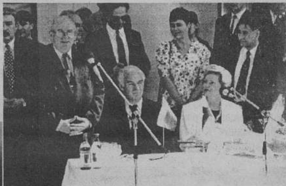
Министры России и Финляндии. Выступает губернатор Ленинградской области Александр Беляков

ной связи по всей стране. Это позволит перейти на совершенно новую технологию работы с клиентом, чему способствует создание при железных дорогах мощнейшей банковской системы. Начало такой работы положено здесь - на Бусловской.