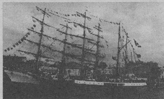
Петербургский этап регаты Катти Сарк закончен. Корабли ушли в море.

Раньше лес пускали в дело сразу по прибытии, теперь же его выдерживают в больших штабелях, составляя просветы для свободной циркуляции воздуха. В морозы его накрывают большими полотнищами, чтобы защитить от непогоды, почти также как в Италии закрывают цитрусовые.