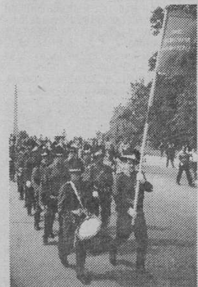
Реконструкцию формы одежды эпохи войны 1812 года показывает клуб из Финляндии. На площади Коннетабля

В середине июля в Санкт-Петербурге и Гатчине проходили парады и батальи