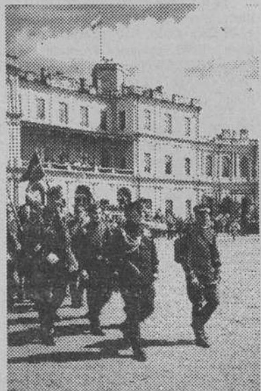
Военно-историческая реконструкция формы одежды "Дроздовского полка" времени первой мировой и гражданской войн. На плацу Павловского дворца

Но самым красочным и насыщенным стал последний день фестиваля, когда праздник переместился в Гатчину, город плац-парадов времен Павла I