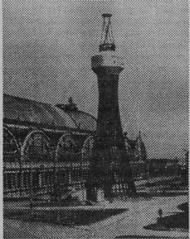
Водонапорная башня, инженер В. Г. Шухов.

Среди частных павильонов, построенных аналогичным способом и выдержанных в духе национальных стилиза-