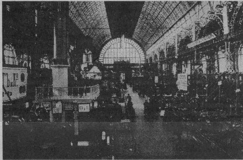
Машинный павильон, архитектор А. Н. Померанцев, конструкция Санкт-Петербургского металлического завода.

От редакции: Статья, публикация которой мы начали в предыдущем номере, нашим читателям из Рыбацкого может быть интересна еще и тем, что в Нижегородской ярмарке 1896 года участвовали потомки первых поселенцев