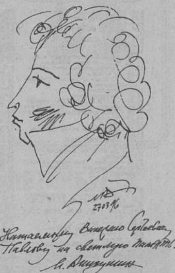
Так изобразил поэта М. К. Аникушин, приветствуя организаторов V Пасхального фестиваля