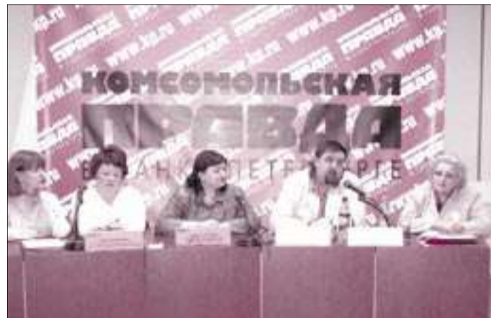
Пресс-конференция «Детское общественное движение. История и перспективы» в пресс-центре газеты «Комсомольская правда в Санкт-Петербурге».

Именно к этой дате приурочены мероприятия, организованные для детей и при их непосредственном участии.