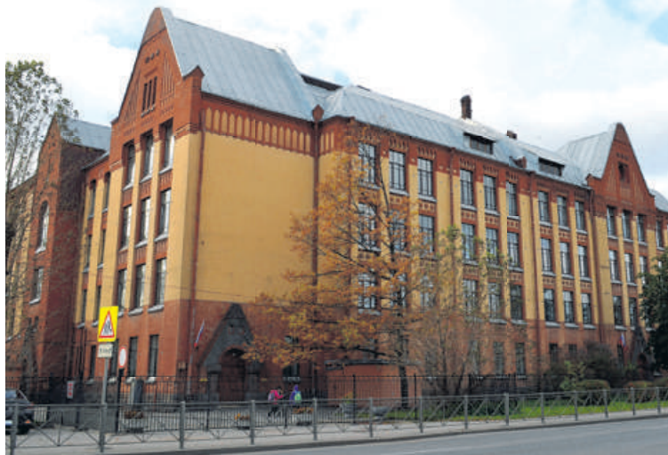
115 лет назад при Обуховском заводе была построена техническая школа, которая и сегодня продолжает успешно работать.

В честь юбилея школы в её стенах открылась планшетная выставка, посвящённая архитектуре Лумбергу. На шести