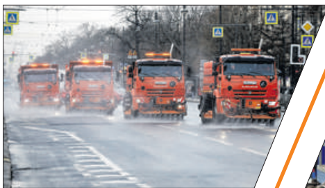
УЛИЦЫ ВЫМОЮТ С ШАМПУНЕМ