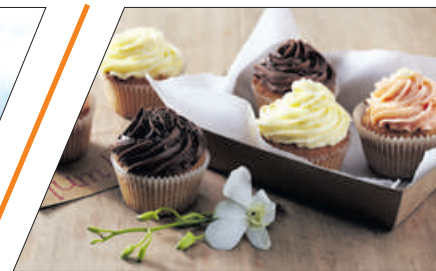
ПОХУДЕТЬ К ЛЕТУ И НА ВСЮ ЖИЗНЬ