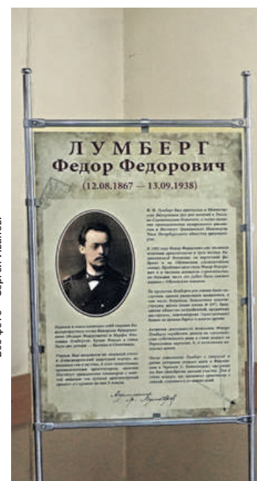
Выставка будет доступна для учащихся и гостей школы № 337 в течение месяца, после чего экспозиция вернётся в фонды Музея истории Обуховского завода.