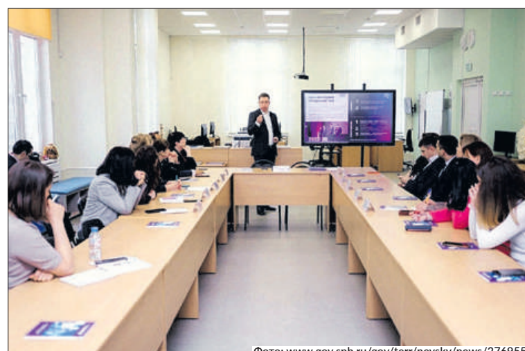
В школе № 334 состоялся Региональный отборочный этап школьной лиги Всероссийского инженерного чемпионата «Кейс-Ин».