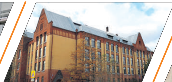
ШКОЛЕ № 337 ИСПОЛНИЛОСЬ 115 ЛЕТ