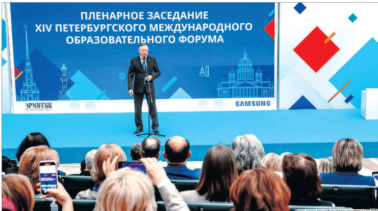
«Спрос на хорошие кадры очень высок, но начинать их готовить надо еще за школьной партией», – сказал губернатор Александр Беглов на заседании Петербургского международного образовательного форума «Создаём будущее сегодня», который прошёл с 25 по 29 марта. В нём приняли участие более 35 тысяч руководящих и педагогических работников системы образования Российской Федерации.