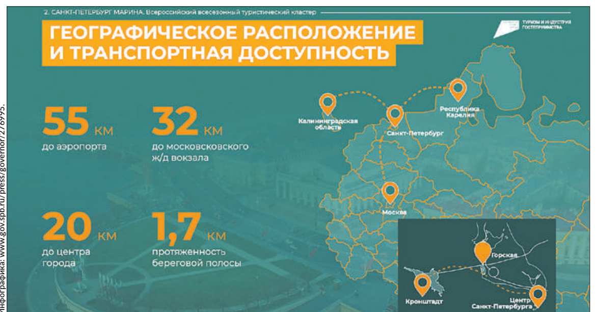
Одним из крупнейших элементов проекта станет туристический кластер «Санкт-Петербург Марина», создаваемый на территории бывшей строительной площадки «Горская».

По словам президента, до 2030 года предстоит почти вдвое – до 140 миллионов – увеличить число ежегодных путешествий по стране. А для этого необходимо расширять доступное предложение туристических услуг, что называется, на любой вкус, чтобы граждане могли увидеть уникальную природу России, прикоснуться к нашей великой истории и культуре, отдохнуть на морских, горнолыжных, оздоровительных курортах, в круглогодичных парках развлечений.