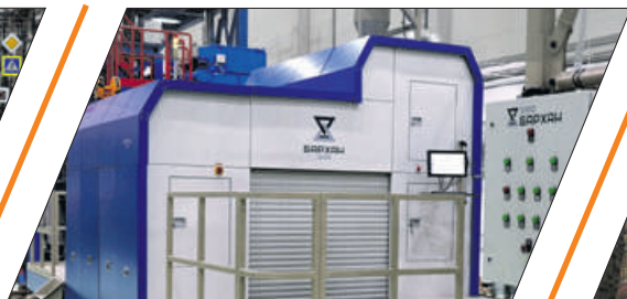
ПРИНТЕР «БАРХАН» И ПЕСКИ ВРЕМЕНИ