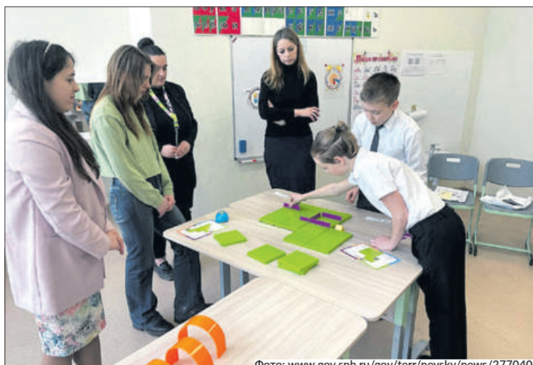
Гостей школы № 707 познакомили с ее возможностями по формированию инженерной культуры у подрастающего поколения.

Гостям семинара представили модель методической службы школы. Она построена на основе деятельности инициативных групп и позволяет управлять образовательным процессом через проект Инженерно-технологического кампуса. Сейчас в него входят 12 лабораторий.