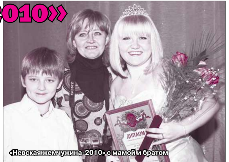
«Невская жемчужина-2010» с мамой и братом