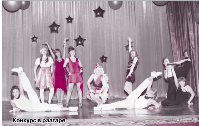
Конкурс в разгаре