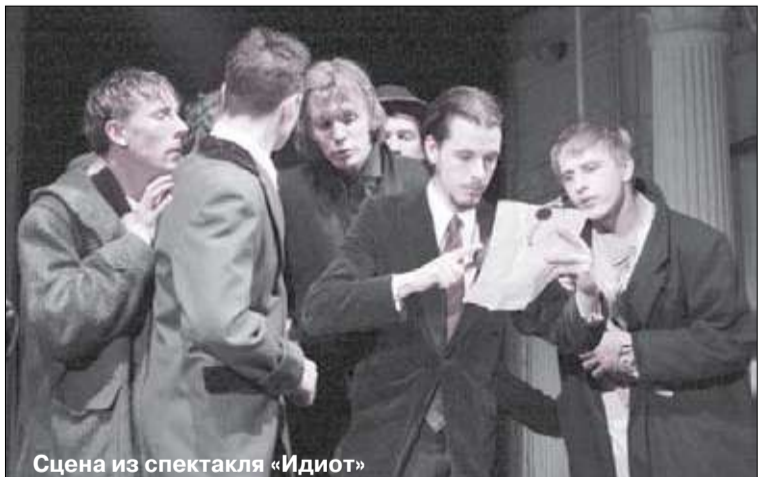
Сцена из спектакля «Идиот»

27 лет здание на Народной улице, д. 1 было известно петербургским зрителям как театр «Буфф». Однако в этом году его труппа переехала в новое помещение, а упомянутый дом заняла «Открытая сцена» – своеобразный театральный ковчег для нескольких творческих коллективов, не имеющих собственной сценической площадки.