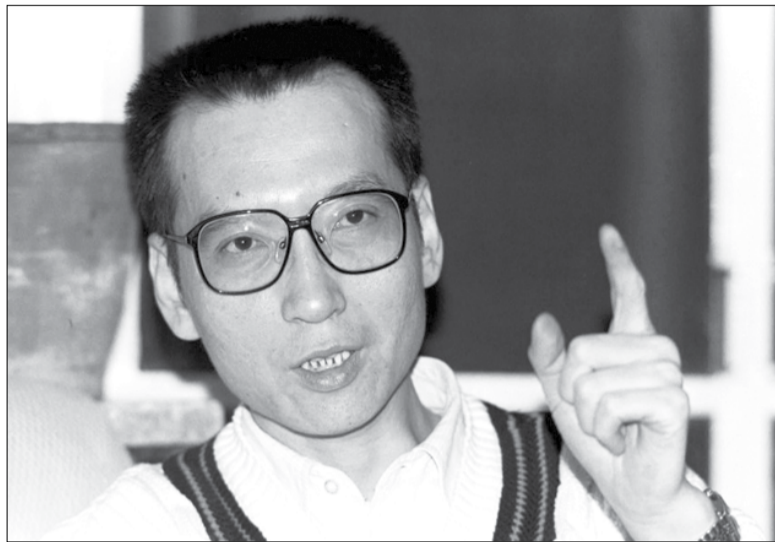
Китайский правозащитник Лю Сяобо – эндаумент-герой уходящего года. Недавно ему присудили Нобелевскую премию мира.

ФССВ не зря стал организатором подобной конференции (одной из первых, кстати, в городе), ведь задача управляющей компании – разумно рисковать