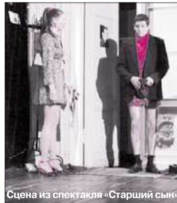
Сцена из спектакля «Старший сын»

На основной сцене обособятся «Мастерская» Григория Козлова, лауреата Государственной премии России, заслуженного деятеля искусств России и продолжателя традиций русского психологического театра. С 1995 года он преподает в Санкт-Петербургской академии театрального искусства, и актеры