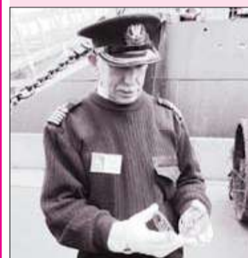
УЧЕНЫЕ СОБРАЛИСЬ НА ЛЕДОКОЛЕ «КРАСИН»