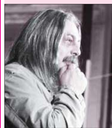
ВО ДВОРЦЕ ТВОРЧЕСКОГО ПОИСКА