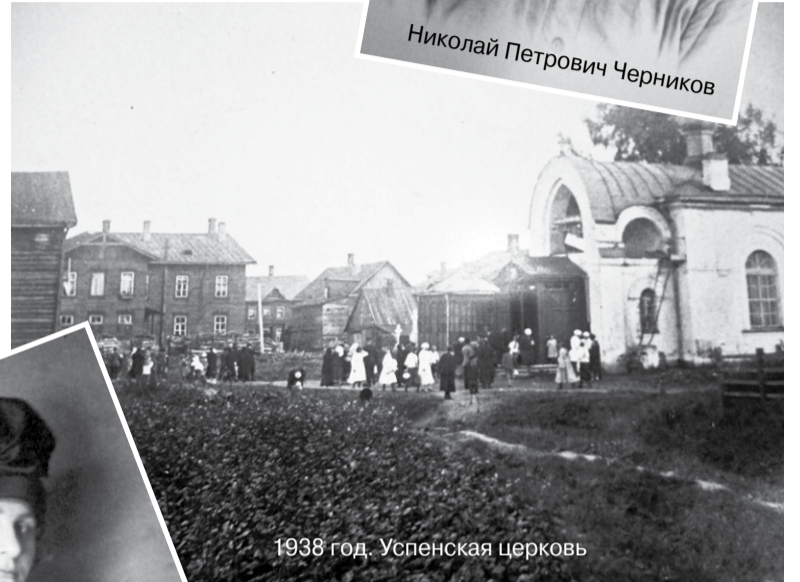
1938 год. Успенская церковь