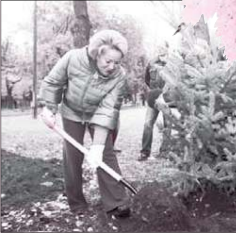
ГУБЕРНАТОР ВАЛЕНТИНА МАТВИЕНКО ПРИНЯЛА УЧАСТИЕ В ОБЩЕГОРОДСКОМ СУББОТНИКЕ.

Она поблагодарила всех участников, – а это около 200 тысяч петербуржцев. «Важно, чтобы каждый житель внес свою лепту в благоустройство Петербурга. Тогда будет бережное отношение к городу, не будет мусора, сорванных цветов», – сказала Валентина Матвиенко.