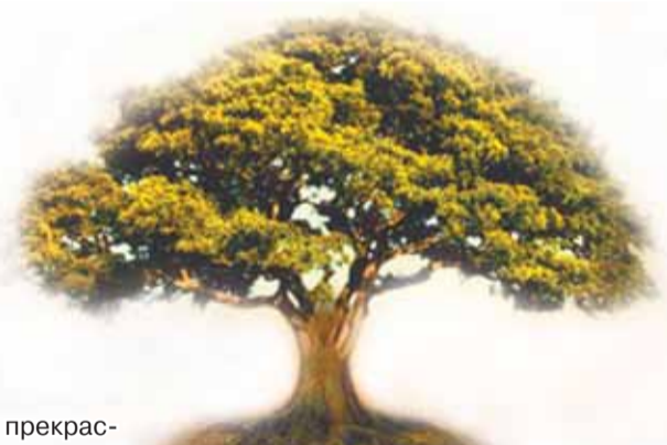
Поиск родственников можно начать на официальном сайте Первого канала на странице телепроекта «Моя родословная»