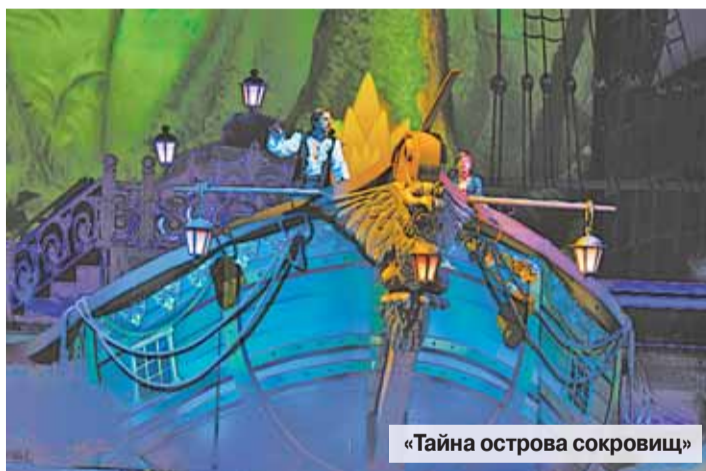
«Тайна острова сокровищ»

Предварительная запись – по телефону: 362-18-10. Адрес музея: Ново-Александровская ул., 23.