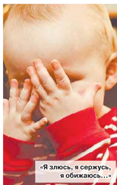
«Я злюсь, я сержусь, я обижаюсь...»

Психологи выяснили, что чувства должны выражаться вслух со словом «я», высказываниями «Я злюсь, я сержусь, я обижаюсь...» Когда чувство называется словом, энергия этого чувства уменьшается, приносит облегчение, и можно приступить к решению пробле-