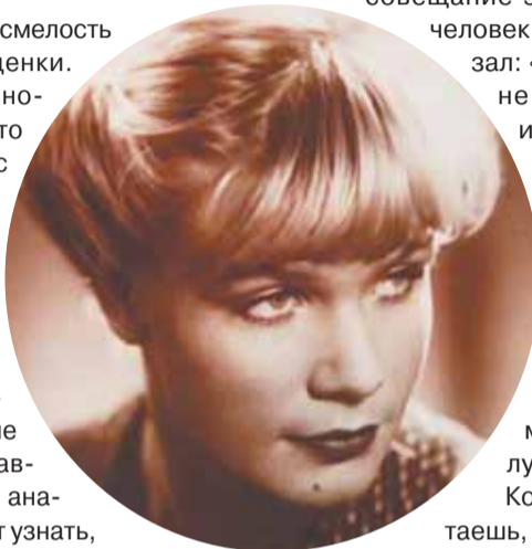
Бывший контрразведчик и будущий президент России Владимир Путин мог отложить дела, чтобы дать комментарий к ее материалу.